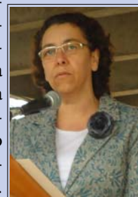
Rosely Moraes Presidente da Câmara Municipal de Cambuí

Além disso, realizamos a audiência pública no dia 22 de maio para discutirmos com as autoridades e a população as soluções possíveis para essa problemática. Com isso demos o pontapé inicial e esperamos e que as demais autoridades do município dêem prosseguimento às ações de combate à criminalidade e à violência.